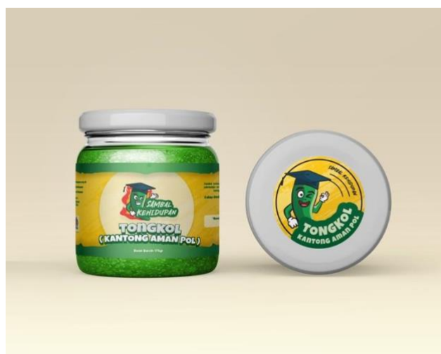
Gambar 10. Tampak samping dan tampak atas pada tampilan label di kemasan toples kaca.