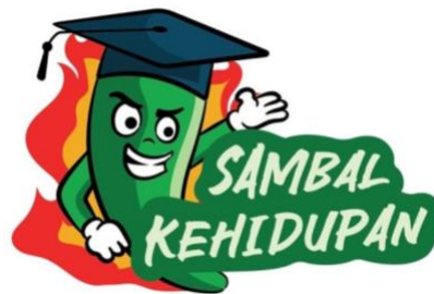
Gambar 7. Tampilan master logo Sambal Kehidupan yang terpilih.

Sambal Kehidupan mempunyai pandangan ke depan, salah satunya menjadikan sambal sebagai identitas kuliner nusantara. Di daerah Jawa Tengah sambal hijau belum banyak di pasaran yang serius merancang Brandingnya, terlebih yang menggarap segmen mahasiswa dan warga kost. Hal ini menjadi peluang bagi Sambal Kehidupan untuk menjual kekhasan produknya. Identitas logo masih fokus pada visual utamanya yaitu sambal hijau memakai topi toga, hal ini masih tetap dipertahankan agar lebih tersirat marketnya kepada golongan mahasiswa. Pernyataan tersebut disahkan oleh tim pakar untuk tidak menghilangkan citra produknya. Sambal hijau dengan ekspresi yang membangkitkan tawa memberikan persepsi konsumen muda dan bergurau, hal ini diperkuat dengan visual topi toga untuk mencerminkan mahasiswa dan persepsi pedas terwakili oleh latar api dengan warna kuning dan merah yang berkobar.