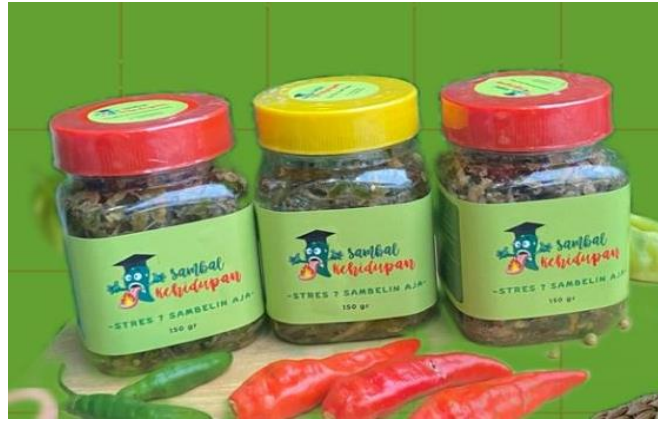
Gambar 4. Kemasan Sambal Kehidupan dengan toples plastik