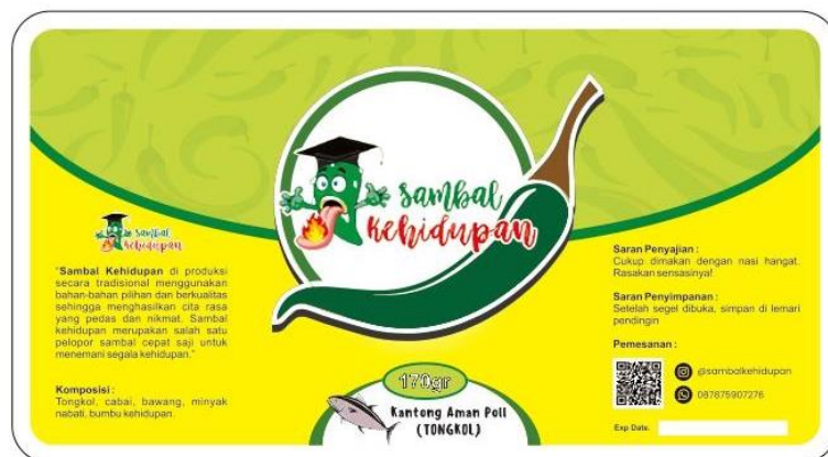
Gambar 6. Label kemasan Sambal Kehidupan dengan tampilan logo awal.

Brand Image suatu merek dapat dilihat dari maskot merek tersebut. Sebuah contoh merek makanan cepat saji yang terkenal telah menunjukkan kepada dunia pemasaran mengenai pengaruh adanya maskot suatu merek. Maskot dinilai sangat efektif dalam menciptakan kesadaran merek akannya sebuah nilai yang mudah dikenali dan mudah diingat. Tujuan dari penciptaan maskot adalah untuk membangun identitas brand yang positif dan menarik minat audiens (Caufield, 2012). Membuat maskot juga adalah cara untuk membangun identitas brand dan menciptakan perhatian publik kepada brand tersebut. (Mohanty, 2014).