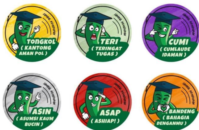
Gambar 9. Tampilan stiker tutup botol sambal tiap varian rasa & bahan.

Konsep desain maskot menyesuaikan ekspresi dengan rasa produk sambal yang ada dan yang sesuai dengan singkatan dari rasa tersebut, seperti rasa teri (teringat tugas) dengan ekspresi panik dan kaget. Rasa cumi (cumlaude idaman) dengan ekspresi check it out . Rasa tongkol (kantong aman pol) dengan ekspresi OK. Rasa asin (asumsi kaum bucin) dengan ekspresi jari hati; sebuah isyarat dimana seseorang membentuk sebuah bentuk hati memakai jari telunjuk dan jempol. Rasa asap (ashiap!) dengan ekspresi hormat. Rasa bandeng (bahagia denganmu) dengan ekspresi tangan membentuk tanda cinta. Beragam desain maskot diatas hanya untuk dipakai di label atas kemasan dengan ekspresi maskot dan warna yang berbeda ditiap rasa variannya.