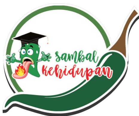
Gambar 3. Logo Sambal Kehidupan