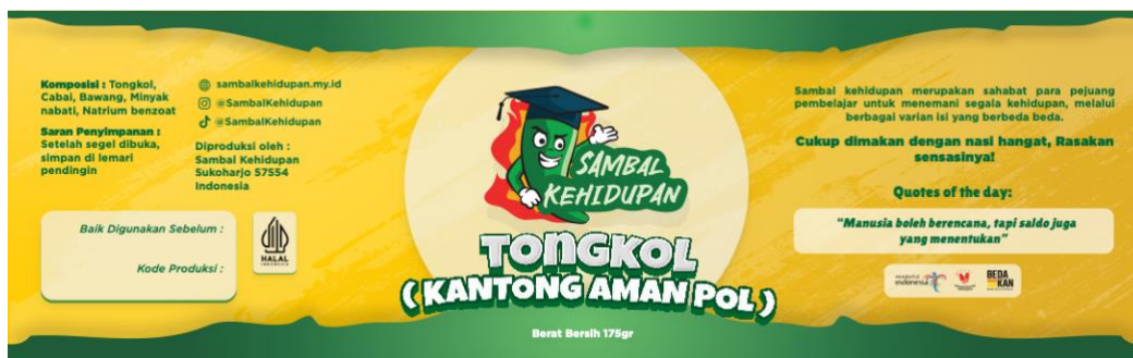
Gambar 11. Label kemasan Sambal Kehidupan dengan tampilan logo baru dan desain label baru.

Desain kemasan mempunyai kategori rancangan grafis dan struktur suatu kemasan. Menurut Klimczuk dan Krasovec (2007) yang menyatakan bahwa desain kemasan terdiri dari gambar, warna, tanda merek, bentuk dan struktur. Desain kemasan sebagai alat bantu pemasaran dengan prasyarat untuk mengemas, melindungi, mengirimkan, dan membedakan produk di pasar. Pada topik ini Sambal Kehidupan terdapat perbaikan dan kebutuhan produksi untuk mendukung pemasaran. Adapun perbaikan desain pada label kemasannya, berupa bahan label yang dipakai dan konten labelnya berupa warna, gambar, tipografi dan elemen desain lainnya serta informasi produk.