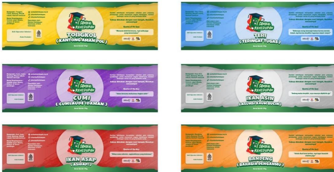
Gambar 12. Tampilan terbuka pada label Sambal Kehidupan terdapat enam varian rasa dan bahan pada kemasan botol kaca.

tersebut diharapkan mencerminkan kekuatan dan keunggulan kompetitif suatu produknya.