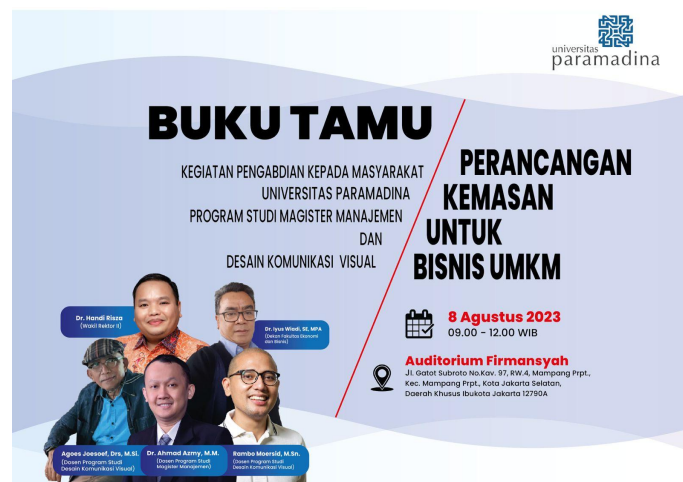
Gambar 13. Cover Buku Tamu