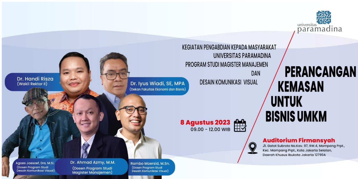
Gambar 12. Materi Publikasi Banner Backdrop