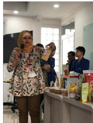
Gambar 10. Kolase Foto Suasana Diskusi dan Sesi Tanya Jawab