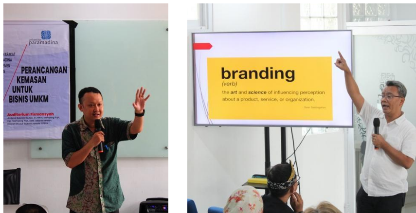
Gambar 3. Pemateri pertama dari Program Studi Magister Manajemen.