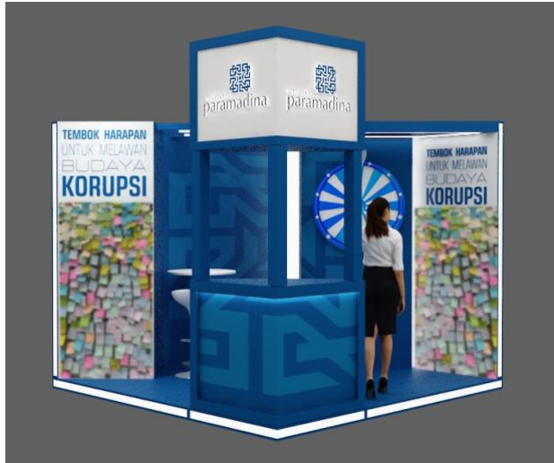
Gambar 4. Model visual 3D dari sudut. Media interaksi memakai dinding booth dengan konsep Tembok Harapan yang ditempel sticky notes.

Memaksimalkan desain booth dengan dua sisi terbuka menjadi tampak lebih merekah, atas dasar nilai estetika berjiwa terbuka, rancangan ini pada hakikatnya mempunyai pesan suka mendengarkan pendapat orang lain. Implementasi desain komunikasinya dikuatkan pada kedua dinding kanan dan kiri sebagai media interaktif yang bertuliskan Tembok Harapan Melawan Budaya Korupsi. Harapannya supaya ada masukan dari audiensi HAKORDIA berupa opini, kritik dan usulan mengenai keinginan pribadi supaya menjadi kenyataan.