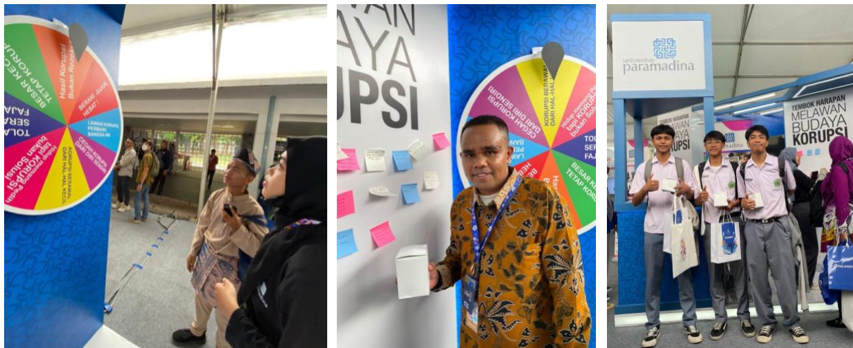
Gambar 6. Foto kiri, peserta memutar roda keberuntungan. Foto tengah, peserta telah menulis opini di Tembok Harapan Melawan Budaya Korupsi. Foto Kanan, peserta mendapatkan suvenir.

Interaksi dirancang oleh mahasiswa DPI dan DKV dengan memasukkan konten anti korupsi pada roda keberuntungan ( wheel fortune ). Media interaksi ini sifatnya games , aturan permainannya, audiensi sebagai peserta permainan diminta untuk memutar roda keberuntungan yang sudah disediakan. Lalu, peserta akan mendapatkan satu poin yang berisi slogan anti korupsi dari roda keberuntungan yang diputar. Terdapat delapan poin slogan anti korupsi yang tersedia di dalam roda keberuntungan, sebagai berikut: Berani Jujur, Hebat!, Lawan Korupsi, Perbaiki Bangsa Ini. Cegah Korupsi Dari Diri Sendiri. Korupsi Berawal Dari Hal-Hal Kecil. Suap Adalah Umpan, Jangan Jatuh Kedalam Perangkap Mereka, Tolak Serangan Fajar, Besar Kecil Tetap Korupsi, Karena Dalam Demokrasi Tidak Ada Tempat Untuk Korupsi.