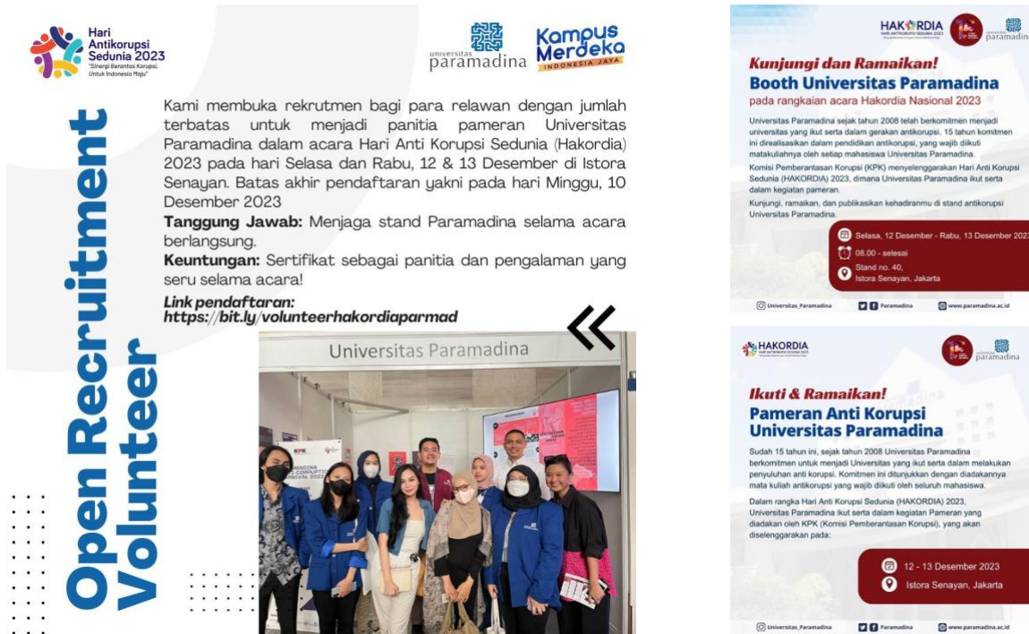
Gambar 8. Foto kiri, poster digital mengenai perekrutan sukarelawan. Foto kanan dari atas ke bawah, Instagram Feeds yang menginformasikan peran serta Paramadina di acara HAKORDIA Nasional 202

Pendampingan berikutnya pada aspek audio visual yang ditampilkan pada layar LED ukuran 65 inch, posisi layar ditengah dua bidang tembok harapan. Layar tersebut untuk mengisi sejumlah informasi pencapaian yang sudah 15 tahun dilaksanakannya mata kuliah Anti Korupsi di Universitas Paramadina. Secara garis besar kontennya antara lain: Kutipan Cak Nur terkait korupsi. Slogan; Menyentuh Nurani, Menajamkan Nalar, Menggerakkan Aksi. Dan, capaian 15 tahun pendidikan Anti Korupsi.