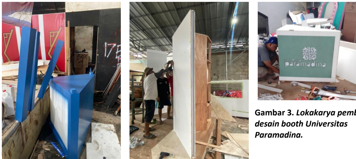
Gambar 3. Lokakarya pembuatan desain booth Universitas Paramadina.

Konsep pameran disiapkan untuk dapat menciptakan nilai komunikasi yang optimal kepada masyarakat umum atau audiensi Istora Senayan. Desain booth dengan ukuran 3 meter x 3 meter sudah ditentukan dan disiapkan oleh penyelenggara pameran dengan posisi di sudut area. Tim desainer terdiri dari dosen dan mahasiswa dari program studi DKV dan DPI yang berkolaborasi dengan alumni, membentuk booth dengan tersingkap dari dua sisi. Ruang terbuka diciptakan untuk menghadirkan interaktif antara pengunjung dengan tim dosen Anti Korupsi.