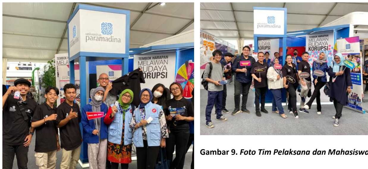
Gambar 9. Foto Tim Pelaksana dan Mahasiswa.