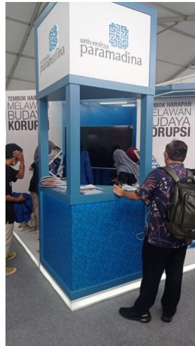
Gambar 7. Foto kiri, Foto nyata pada suasana sore. Foto kanan, peserta berada di tower Universitas Paramadina yang sekaligus berfungsi sebagai meja pusat informasi.

Pada pendampingan desain booth Universitas Paramadina disiapkan beragam multimedia untuk menunjang interaksi pengunjung atau peserta. Booth sebagai media offline , selain fisiknya perlu dimasukan unsur estetika visualnya. Logo Universitas Paramadina sebagai Identitas utama harus ditempatkan istimewa yakni pada posisi atas tower dan terlihat bersih tanpa ada distraksi visual lainnya. Selain itu, warna biru madani ditampakkan jelas agar menjadi sebuah identitas – penanda keluasan berpikir, kedalaman ilmu dan iman. Biru madani tidak flat begitu saja, tetapi diisi dengan aesthetic elements Paramadina, sebuah keindahan visual yang di dalamnya terdapat unsur aksara arab kaf dan ha pada sebuah grafis repetitif.