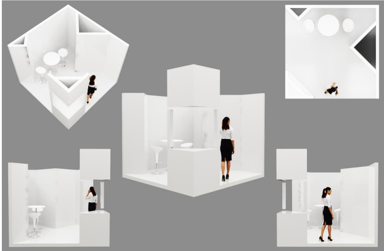
Gambar 2. Desain 3D dari berbagai sudut.

Konsep pameran disiapkan untuk dapat menciptakan nilai komunikasi yang optimal kepada masyarakat umum atau audiensi Istora Senayan. Desain booth dengan ukuran 3 meter x 3 meter sudah ditentukan dan disiapkan oleh penyelenggara pameran dengan posisi di sudut area. Tim desainer terdiri dari dosen dan mahasiswa dari program studi DKV dan DPI yang berkolaborasi dengan alumni, membentuk booth dengan tersingkap dari dua sisi. Ruang terbuka diciptakan untuk menghadirkan interaktif antara pengunjung dengan tim dosen Anti Korupsi.