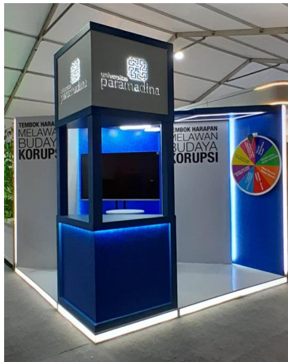
Gambar 5. Penerapan booth Paramadina di Istora Senayan – HAKORDIA 12 Desember 2023.