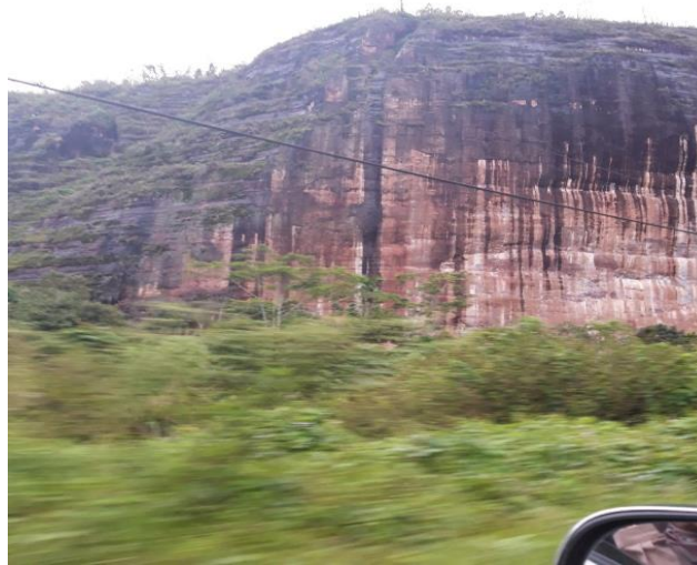
Gambar 1. Lembah Harau

diambil dengan kendaraan pribadi dan pengunjung dari luar kota biasanya datang dengan bus besar. Bus dan kendaraan pribadi akan dikenakan biaya parkir yang berbeda.