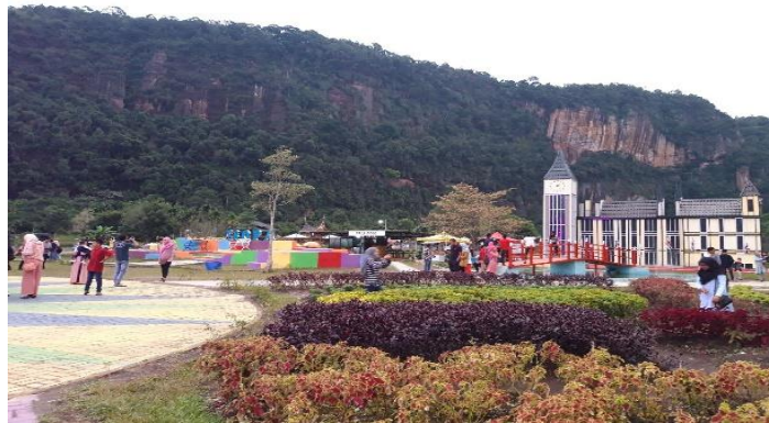
Gambar 4. Kampung Eropa

Instagram, aplikasi media sosial yang dibuat oleh Kevin Systorm dan Mike Krieger pada 2012 bukan hanya aplikasi berbagi foto untuk pengguna, tetapi telah menjadi sarana untuk mendapatkan keuntungan. Hal ini terjadi tidak terlepas dari perkembangan teknologi saat ini yang berlangsung begitu cepat sehingga Coyle dan H. Vaughn (2008) menyebut fenomena ini sebagai sebuah revolusi. Aplikasi berbagi foto dan video Instagram dapat disebut media sosial favorit berikutnya untuk milenium di Indonesia. (Dalam Penelitian Afdal Makkuraga Putra, Annisa Febrina berjudul Selebgram Child Phenomenon: Understanding Parent Motives . Jurnal ASPIKOM. Volume 3, Nomor 6, Januari 2019).