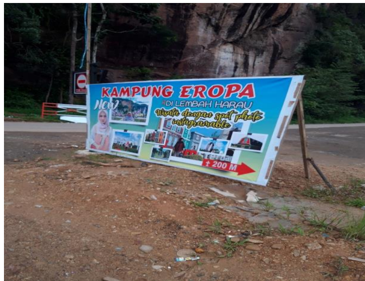
Gambar 3. Papan Informasi

Kedua, wilayah Lembah Harau sebenarnya dibagi menjadi dua. Bagi yang ingin menikmati pemandangan alam dan keindahan, biasanya wisatawan asing lebih menyukai tempat ini, keindahan alamnya dan disediakan beberapa wahana yang tidak buatan manusia, membuat wisatawan asing tertarik. Berbeda dengan daerah lain yang dikembangkan oleh manajer. Tempat ini lebih berwarna dan hanya dikunjungi oleh wisatawan lokal / nasional seperti Medan, Pekanbaru, Jambi, Lampung dan kota-kota lain. Untuk pariwisata lengkap, penduduk setempat biasanya berpartisipasi dengan menyewakan rumah mereka sebagai pengunjung homestay. Tarif untuk masa inap bervariasi dengan kisaran harga Rp. 400.000 - Rp. 800.000. Selain itu ada beberapa warung makan yang menyediakan menu lokal yang murah dan enak.