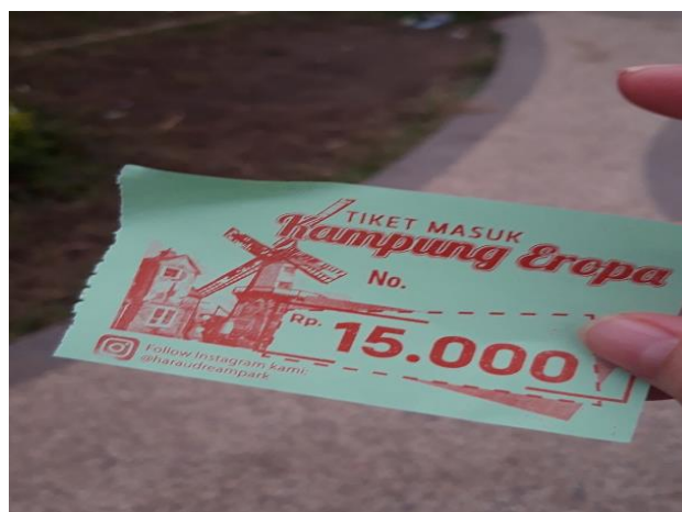
Gambar 2: tiket masuk

Sebelum memasuki daerah ada pos pemuda desa yang akan menghentikan kendaraan pengunjung. Biasanya mereka akan membebankan biaya Rp. 5.000 / orang sebagai tiket untuk memasuki wilayah tersebut. Menurut peneliti, ini tidak baik karena mereka mengganggu pengunjung, sayangnya hal ini belum ditangani oleh Pemerintah Kota Payakumbuh. Selanjutnya untuk memasuki Lembah Harau, pengunjung juga akan dikenakan biaya yang sama sebesar Rp5.000 / orang sebagai tiket parkir dan masuk. Untuk menikmati wahana yang tersedia, pengunjung dikenakan biaya suka berfoto di European Village, biayanya Rp. 15.000 / orang. Naik sepeda tali yang digantung seharga Rp40.000.