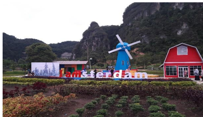
Gambar 5. Kampung Eropa

Desa Eropa adalah salah satu fenomena pariwisata di Sumatera Barat yang sangat populer di kalangan pengunjung selain Pantai Mandeh, Pantai Tarusan dan Pulau Mentawai. Tur ini semakin ramai dengan pengunjung ketika musim liburan tiba. Terlebih saat libur Idul Fitri biasanya untuk sampai ke sana membutuhkan waktu dua jam dan sangat ramai dengan mobil, sepeda motor dan bus besar. Ketika mereka tiba di Desa Eropa, pengunjung diharuskan membayar biaya masuk sebesar Rp. 15.000 per orang. Di sinilah objek wisata ini karena ada begitu banyak tempat berwarna-warni yang menarik untuk dijadikan foto latar belakang.