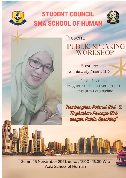
Gambar 3. Eflyer Public Speaking Workshop

Pelatihan public speaking dimulai dengan mengenal satu sama lain para peserta secara kreatif dan menarik, lalu mencoba menganalisis potensi diri masing-masing peserta. Kemudian diberikan materi mengenai definisi, strategi dan kiat-kiat public speaking secara menyeluruh yang harus diketahui. Bagaimana mengatasi rasa takut untuk tampil di depan umum, mengatasi demam panggung, dan bagaimana mengembangkan kreativitas ketika melakukan public speaking . Pada akhir acara, setiap peserta diminta untuk praktek public speaking secara berpasangan dengan membawakan tema public speaking yang berbeda-beda. Setiap peserta harus mampu mempraktekkan public speaking dengan cara mereka masing-masing secara kreatif. Selanjutnya peneliti akan menilai, memberikan saran dan masukan, agar setiap peserta menjadi lebih baik dalam mempraktekkan public speaking nya.