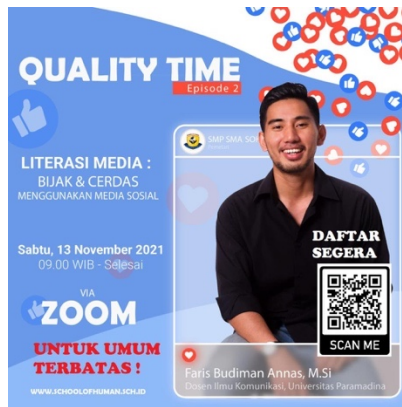
Gambar 1. E-flyer Literasi Media : Bijak dan Cerdas Menggunakan Media Sosial

di layar media. Di lain pihak, acara dapat diikuti peserta secara terbuka melalui media daring. Sosialisasi dilakukan dua minggu sebelum penyelenggaraan acara melalui media sosial untuk menarik minat para guru, siswa, dan orang tua, bukan hanya dari SOH tetapi juga dari sekolah lain. Berikut adalah contoh e-flyer dari sosialisasi pengabdian masyarakat dengan tema literasi media yang diselenggarakan PTA sebagai bagian dari tema quality time episode 2 (dua).