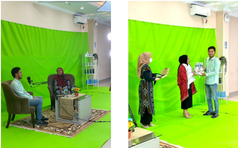
Gambar 2. Aula SOH yang Disulap Apik Menjadi Studio Mini

Penyelenggaraan acara ini juga terhubung dengan link youtube, sehingga mereka yang tidak hadir dapat ikut serta dan menontonnya berulang-ulang. Kemanfaatan dari acara tidak selesai sebatas penyelenggaraan acara tetapi dapat diteruskan kepada mereka yang membutuhkan. Tentunya ini merupakan gelombang penyebaran kegiatan pengabdian masyarakat yang bermanfaat sekaligus menjadi media promosi bagi lembaga pendidikan penyelenggara dan universitas.