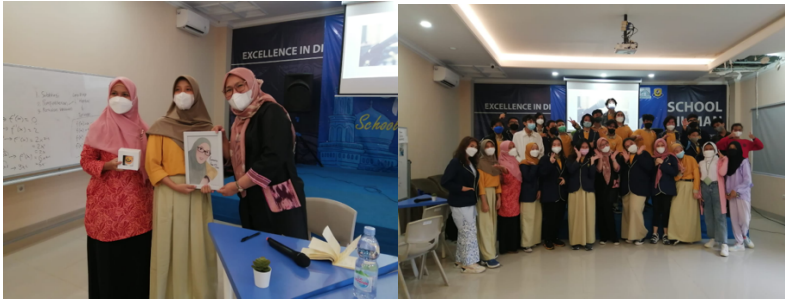
Gambar 4. Suasana Public Speaking Workshop

Seluruh siswa mengikuti pelatihan public speaking hingga akhir, meskipun melebihi batas waktu yang telah ditentukan. Kepala sekolah dan guru yang hadir, ikut senang melihat antusiasme para siswa dalam mempraktekkan public speaking mereka yang kreatif di hadapan para guru. Bahkan ada sejumlah siswa yang bertanya mengenai Program Studi Ilmu Komunikasi karena ingin meningkatkan kompetensi komunikasi yang dimilikinya. Pengalaman siswa belajar mengelola kemampuan public speaking memberikan gagasan kepada pihak sekolah, dimana kepala sekolah dan para guru akan merancang kembali acara program public speaking untuk siswa yang belum sempat mengikuti public speaking workshop . Dengan harapan kemampuan komunikasi para siswa menjadi lebih baik.