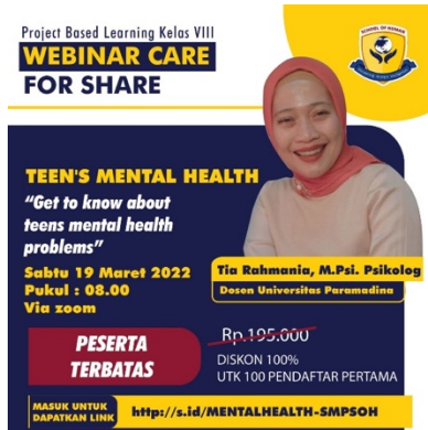
Gambar 5. Eflyer Teen's Mental Health

Acara webinar diselenggarakan di Aula SOH, dimana MC dan pengisi acara hiburan hadir di sana juga. Sementara pembicara webinar berada di tempat yang berbeda, memberikan materi melalui daring. Sebelum acara dimulai, peserta yang hadir langsung di Aula SOH dan peserta yang menyaksikan melalui daring dihibur dengan pertunjukan seni dari para siswa SOH, seperti menyanyi dan membaca puisi. Adapula siswa SOH yang kemudian memberikan tanggapannya terkait kesehatan mental.