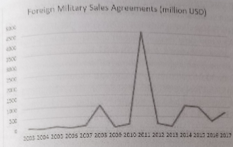
Figure 1: Foreign Military Sales Agreements, 2003 – 2017

Sumber: Rej, A., (2020), "Dalliance No More: How India-US Defence Trade Relationship Matures Over Years", dari https://www.news18.com/news/opinion/dalliance-no-more-how-india-us-defence-trade-relationship-matures-over-years-2510343.html , diakses pada 20 Maret 2020, pukul 20.00wib